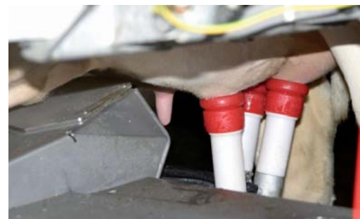
Individjuver innefattar även en funktionstest av mjölkkanläggningen och en genomgång av mjölkkningsrutinerna.