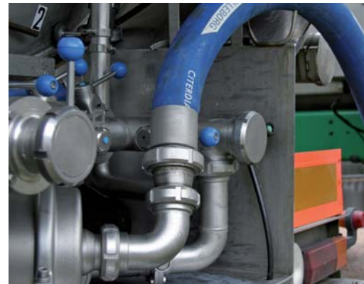
Färre juverinflammationer ger ökad mängd mjölk och lägre tankcelltal.